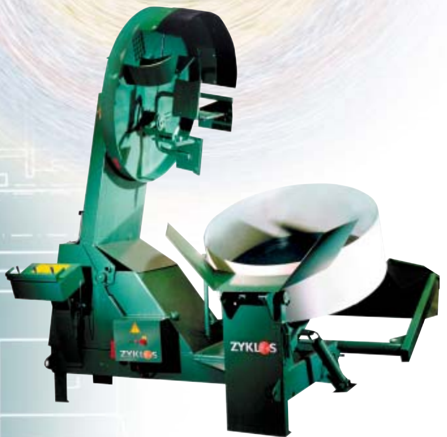
ZK 250 Gleichlauf-Zwangsmischer mit kippbarem Mischteiler